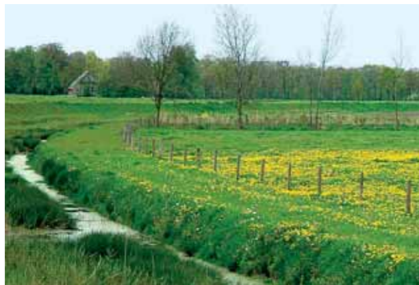
De ecologische verbindingzone langs de Grootte Wetering is een moerasachtige strook aan de voet van de dijk.

De Grootte Wetering is vanaf de Aa in 's-Hertogenbosch tot aan de hoeve 'Corso' van oorsprong een riviertje. Verder richting het oosten is de Wetering afgegraven. Een ecologische verbindingzone is een zone waarin plant- en diersoorten zich kunnen verplaatsen. Deze verbindingzone bestaat uit een strook langs de dijk en twee kleine gebieden met poelen, ruigtes, beplanting en een aangelegde heuvel die mogelijk in de toekomst als dassenburcht kan dienen.