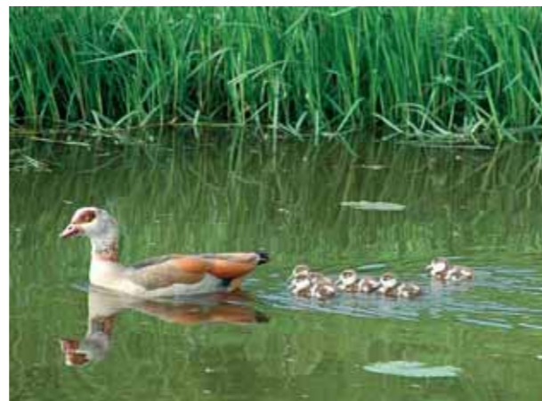
Nijlgezuipen, die oorspronkelijk uit Afrika komen, zijn vaak te vinden in de Grootte Wetering.

Het afwisselende landschap waardoor de route loopt is het leefgebied van veel plant- en diersoorten. In de bossen zijn reeën, uilen en spechten te zien. In ruigtes, zoals bij de ecologische verbindingzone, leven patrijzen. Een plantensoort die kenmerkend is voor houtwallen en bosranden is de koningsvaren, een grote varensort met gladde bladeren.