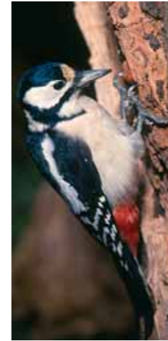
De grote bonte specht.

Het bosgebied Eikenburg is een restant van het landgoed "Eikenburg" dat al in 1787 bewoond was. Kenmerkend voor het Eikenburgbos zijn de rabatten. Dit is een stelsel van greppels en aarden wallen die het aanplanten van bos in natte