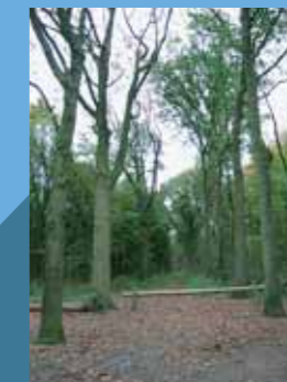
Hooge Heide Weteringroute

U kunt geen rechten ontleen aan deze folder.