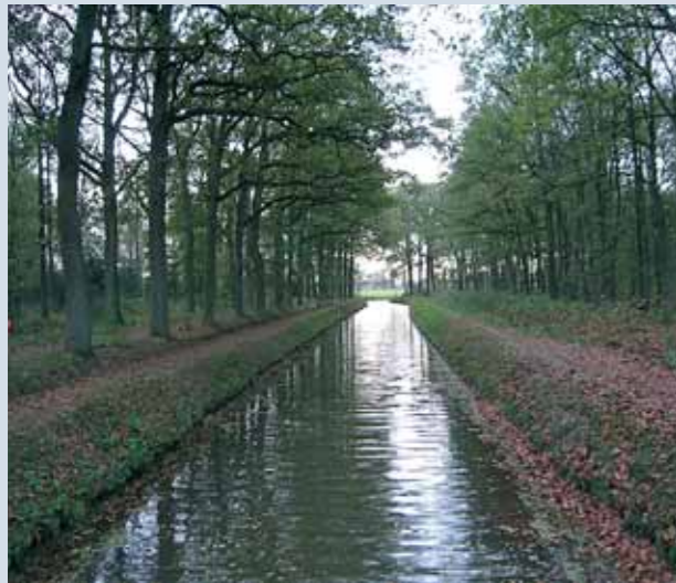
De Kleine Wetering in het Eikenburgbos.

De route is 10,8 kilometer lang en is in ongeveer 2 uur en 15 minuten te lopen. Een deel van de route wordt ook gebruikt door fietsers. Houd hier rekening mee.